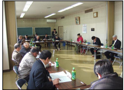
検討委員会での協議の様子