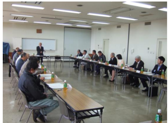
検討委員会での協議の様子

学校跡地の利活用方針(案)や各小学校利活用の方向性(案)については、下記の内容をご覧ください。