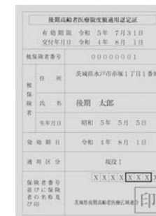
限度額適用認定証(青色)