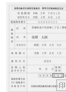
限度額適用・標準負担額減額認定証(黄色)