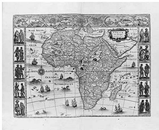
ウィレム・ブラウ、ヨアン・ブラウ 「大地図帳」 (公益財団法人東洋文庫蔵)

【問合せ先】茨城県立歴史館(水戸市緑町2-1-15) ☎029-225-4425 FAX 029-228-4277