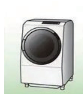
④ 洗濯機・衣類乾燥機