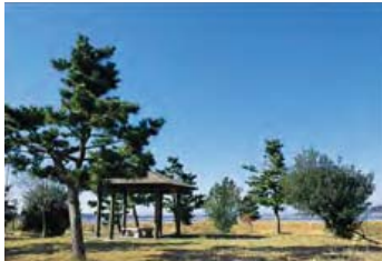
宝塚古墳(町指定史跡)

宝塚古墳は、県内に十数例しか発見されていない前方後方墳で、全長39.3m。周囲には5～7mの溝が巡っていることも確認されました。昭和60年(1985)の発掘調査で見つかった土器の破片などから、この古墳が作られた年代は、今から約1600年前の5世紀はじめと言われています。