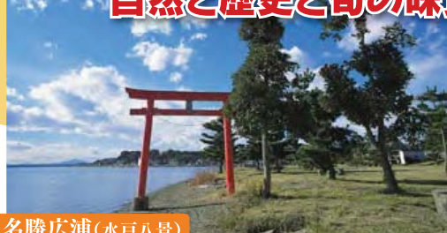
名勝広浦(水戸八景)