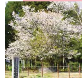
大戸の桜(天然記念物)

水戸黄門で知られる光園公も、觀賞したと伝えられる大戸の桜。樹齢約500年のシロヤマザクラの巨木で、大正時代のはじめ頃には枝が大きくほり出し、その広さは300坪(1000㎡)もあったと言われています。昭和7年(1932年)7月23日に、国の天然記念物に指定されました。