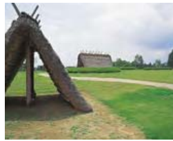
勘十郎堀跡(町指定史跡)

5世紀から6世紀の埴輪工場の跡です。古くから良質の粘土の採れる土地として知られ、材料の粘土を掘った跡、埴輪の形を作ったり、保管していた建物の跡、埴輪を焼いた釜の跡が見つっています。なかでも、釜の数は59基と全国で1番多く、平成4年(1992)に国の指定遺跡になりました。