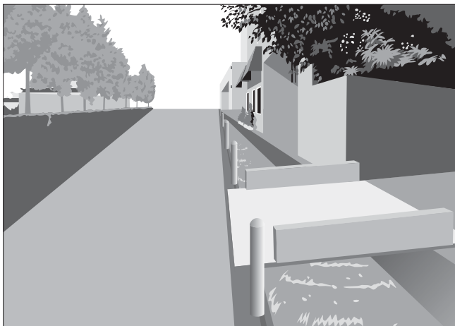
水路に橋や蓋をかけ、敷地への進入路にする場合