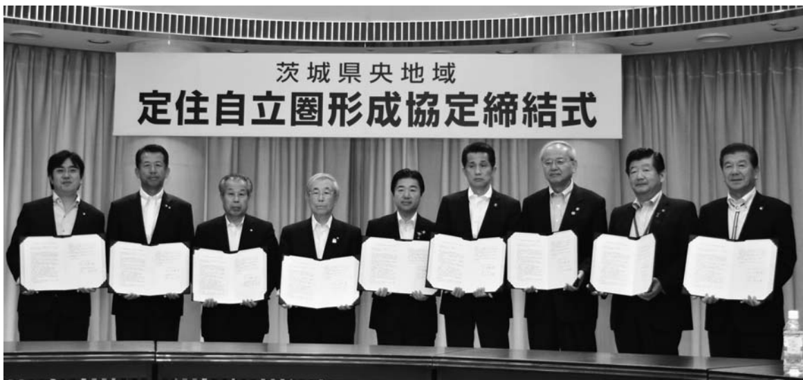
協定締結式の様子