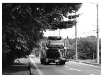
道路に張り出した木とそれを避けようとする車(イメージ写真)

誰もが安心して通行できる安全な道路づくりに、皆さまのご理解とご協力をよろしくお願い致します。