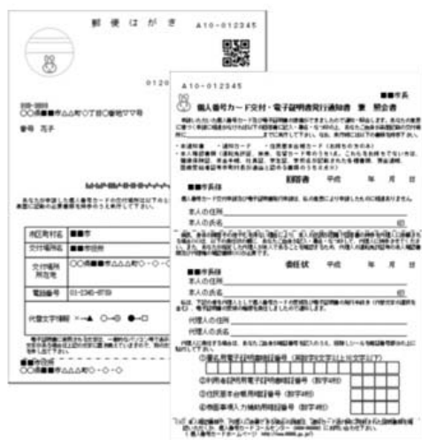
<交付通知書兼照会書>

また、申請者本人が15歳未満若しくは成年被後見人の方については、本人と法定代理人に来庁していただきます。