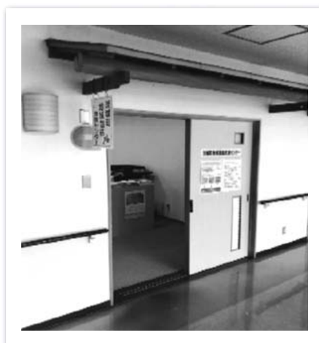
茨城町地域包括支援センター