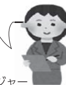
主任ケアマネジャー

地域で暮らす高齢者の状況や変化に応じた支援が出来るよう、多職種連携・協働の体制づくりやケアマネジャーに対する支援等を行います。