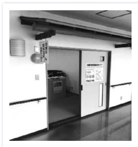
茨城町地域包括支援センター