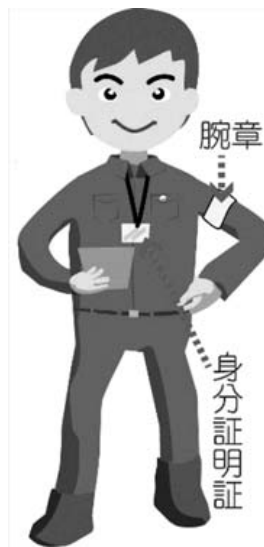
（現地調査員の服装）