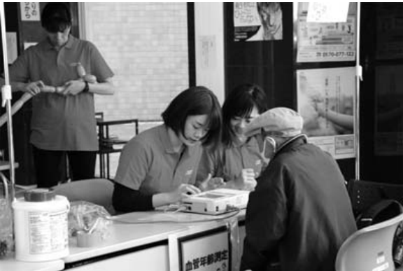
「いばらきまつり」で、ゆうゆう館内に設置された健康相談コーナーの様子

平成30年度はこの補助金を、保健センター(町総合福祉センター「ゆうゆう館」)の維持運営に活用しました。地域住民の健康増進を図る上で欠かせない予防接種や健康診査等、事業の充実を図ることができ、ますます福祉の向上が期待されます。