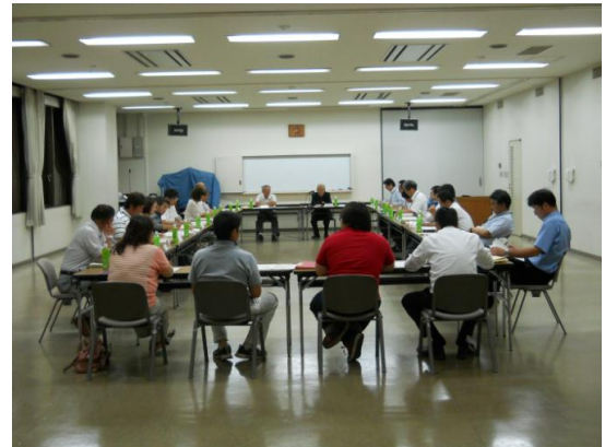
統合準備委員会での協議の様相