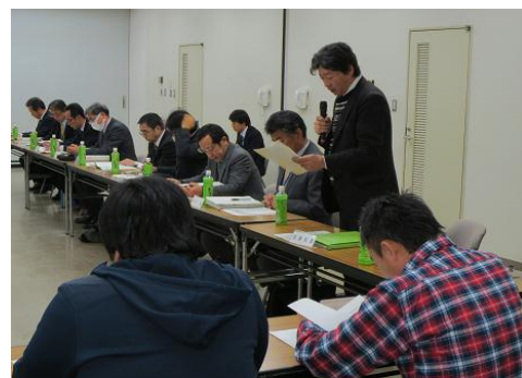
統合準備委員会での協議の様相

※ 次回の統合準備委員会において、上記の内容の他、詳細を記載した募集要項と応募用紙などについて検討・協議し、公募実施へ向け準備を進めます。