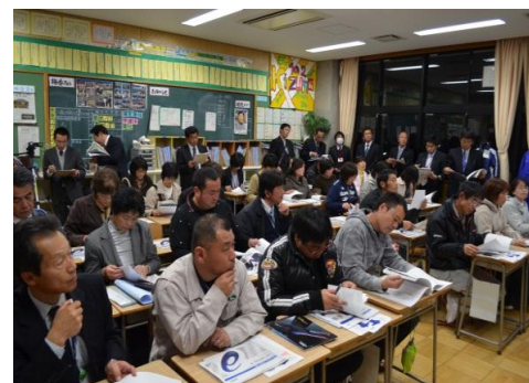
制服プレゼンテーションの様相

◆ プレゼンテーション実施後、両校の生徒及び保護者の皆さまへ内覧をし、投票を行いました。プレゼンテーションに参加された方々と生徒及び保護者の皆さまの投票結果をもとに、制服等検討委員会で十分に検討を重ねた結果、青葉中のジャージ・制服等の業者を以下のように選定しました。