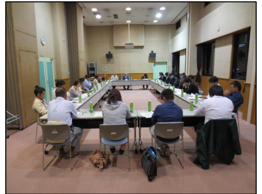
統合準備委員会での協議の様相