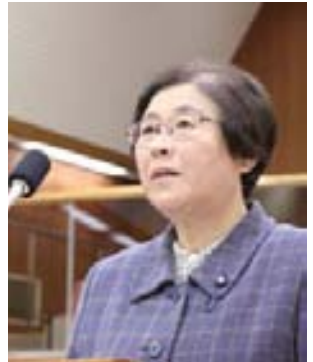
川澄 敬子 議員