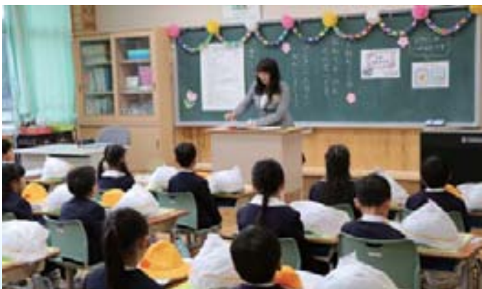
次代を担う子どもたちの教育環境の充実を