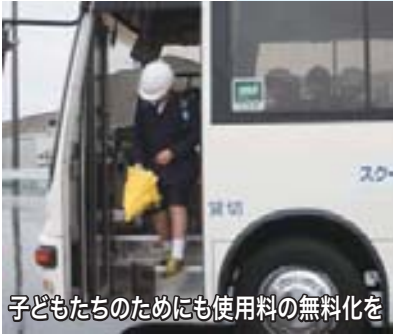
子どもたちのためにも使用料の無料化を

答 地方交付税の算定ではスクールバス1台当たり613万6000円であるが、地方交