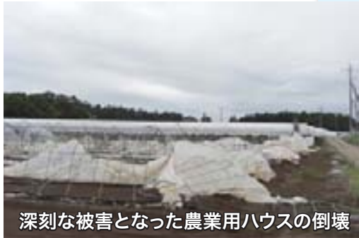
深刻な被害となった農業用ハウスの倒壊

答 台風による農作物や農業用施設等の被害額は約3億5100万円。町では被害状況調査を行い、支援事業の実施を県等に要望し、その結果、国、県、町で、施設の再建・修繕及び撤去に係る経費を助成することとなった。町では補正予算として被災農業者支援事業費補助金を計上。今後は、被災農業者支援はもとより、被害防止のための技術対策の周知や農業共済制度への加入促進など、事前対策に取り組んでいく。