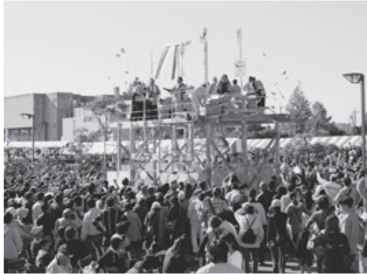
〈昨年(2012)の模擬上棟式の様子〉

【問合せ先】 「2013 いばらきまつり実行委員会事務局」 029-292-1111 (茨城町地域産業課内) 029-292-5979 (茨城町商工会内)