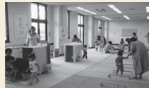
「みんなでピョン」の様子（10月）

～親子で体を使った遊びを楽しみましょう。～ 日 時：22日（水）午前10時30分～11時30分 場 所：保健センター 健診室 内 容：季節の歌、ふれあい遊び、 ふれあい体操、ミニアスレチック など 持ち物：タオル、着替え、水分補給のための飲み物 予約開始日：1月6日（月）