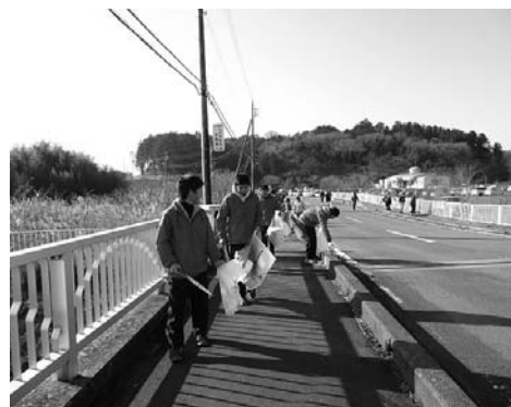
活動に参加した高校生

【参加団体】 網掛ボランティアの会、イオンタウン水戸南、茨城東高校、大澗沼漁業協同組合、さわやかエコの会、自然観察クラブ、水と自然を守る会、町職員