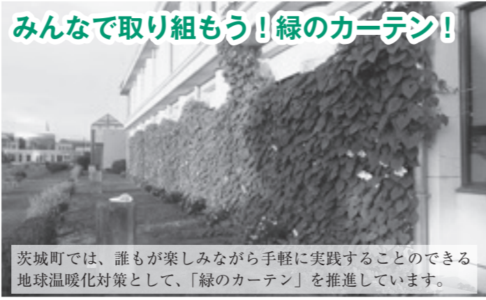
茨城町では、誰もが楽しみながら手軽に実践することのできる地球温暖化対策として、「緑のカーテン」を推進しています。

近年、ヒートアイランド対策として「緑のカーテン」と呼ばれる壁面緑化が広がりをみせています。「緑のカーテン」とは、一般にはゴーヤーや、ヘチマなど、つる性の植物を窓の外に這わせ、夏の強い日差しを和らげる自然のカーテンのことを言います。室温の上昇を抑えるとともに、葉の蒸散効果により周辺温度を下げる効果があるとされています。これにより冷房使用の抑制による省エネルギー効果があり、地球温暖化防止につながります。