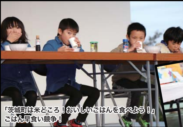
「茨城町は米どころ！おいしいごはんを食べよう！」 ごはん早食い競争！