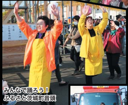
みんなで踊ろう！ ふるさと茨城町音頭