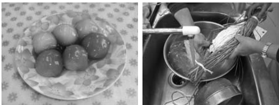
「じゃがいものあやめ団子」

「つと」とは、「わらなどを束ねてその中に食品などを包んだもの」という意味です。 豆腐を塩茹でして水切りした後崩します。わらの中に入れて包み、砂糖と醤油で煮ます。 茨城町では主に冠婚葬祭で作られていたそうです。