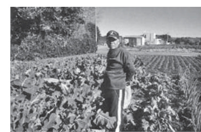
なんだかすぐに食べるのがもったいなくて、友人などに見せると「これはすごい。」と驚いた様子でした。なぜ一本だけこんなに大きく育ったのでしょうか?いつまでも眺めていると、鮮度が落ちてしまうので、娘達と分け合って食べてみると、普通のブロッコリーとなにも変わりのない、おいしいブロッコリーでした。来年も、もっと大きなブロッコリーが出来るかな?と楽しみにしています。

長年、家庭菜園をやってきた、これほど大きく育ったのは初めてです。数あるなかに、ひととき大きなブロッコリーを見つけました。切り取って計ってみると、直径が31cm、重さが1.8kgもありました。