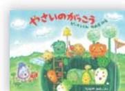
やさしいのがっこう (なかや みわ 著)