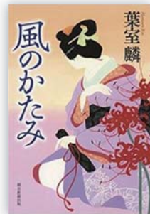
風のかたみ (葉室 麟 著)

九州豊後の安見藩の佐野了弾は、藩の重鎮との政争で、上意討ちに会い、これに反抗をします。藩の目付方から白鷺屋敷で、女・子供の見張りをするように派遣された女医師の目を通して、屋敷の様子が描かれています。スリル感ある時代小説。