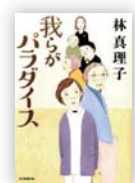
我がパラダイス (林 真理子 著)