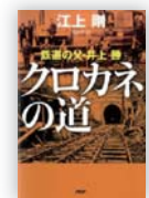
クロカネの道 (江上 剛 著)