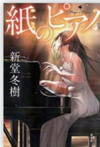
紙のピアノ (新堂 冬樹 著)

白石ほのかは、町のピアノ教師、二ノ宮にピアノを習い、周囲との関わりの中で母の想いを知る。音大に入り、プロのピアニストを目指すためコンクールに挑む彼女の前に、強力なライバル達が現れる。奇跡のメロディに感涙するミュージック小説。