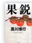
果 鋭 (黒沢 博行 著)