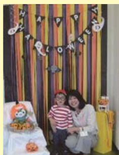
撮影コーナーのイメージ (昨年の様子)

本年はセミナーのかわりに、昨年好評だった写真撮影コーナーをまんまる一む前に設置します。親子で仮装してご自由に記念撮影をどうぞ。撮影に参加された方にサプライズがあるかも知れません。お楽しみに!!