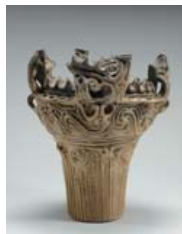
国宝「火焔型土器」(十日町市博物館)

町の防災行政無線が聞き取れなかった場合 防災行政無線テレホンサービス ☎0800-800-8848(通話料無料)