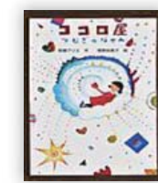
ココロ屋 (梨屋アリエ 作)