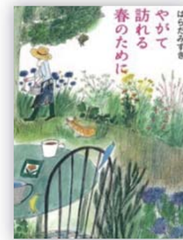
やがて訪れる春のために (はらだみずき 著)

衝動的に会社を辞めた真芽は、入院した一人暮らしの祖母・ハルの代わりに、かつて自分も住んでいた家の庭の様子を見に行く。だが花々が咲き誇ったはずの庭は荒れ果てていた。ハルの不可解な言動と向き合いながら、真芽は庭の手入れを始める。認知症患者をめぐる家族と枯れた庭。一筋縄ではいかない両者の再生物話。