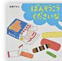
ばんそうこう くださいな (矢野アケミ 作)