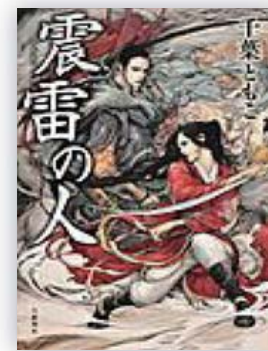
震雷の人 (千葉ともこ 著)

「書の方で世を動かしたい」。文官を目指しながら、信念を曲げず敵陣の刃に倒れた青年・顔季明。彼の許婚の采春は、興行一座に身を隠し、武術を磨きながら季明の仇討ちを計った。一方、采春の兄・張永は、季明の遺志を継ぎ、新皇帝のいる靈武へ。いちどは袂を分けた兄妹の運命が交差するとき、唐の歴史が動き始める。