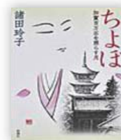
ちよぼ (諸田玲子 著)