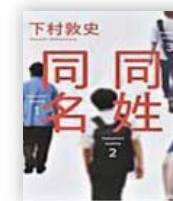
同名同姓 (下村敦史 著)