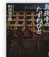
真夜中のたずねびと (恒川光太郎 著)