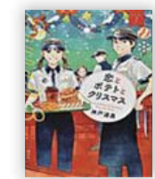
恋とポテトとクリスマス (神戸遥真 著)