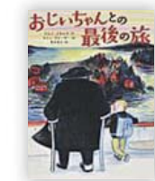
おじいちゃんとの最後の旅 (ウルフ・スタルク 作)