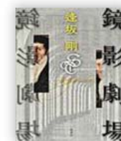
鏡影劇場 (逢坂剛 著)