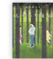
しずかな魔女 (市川 朔久子 作)