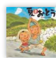
夏とおとうと (ふくだ いわお 作)