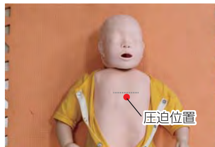
乳幼児に対する胸骨圧迫の位置