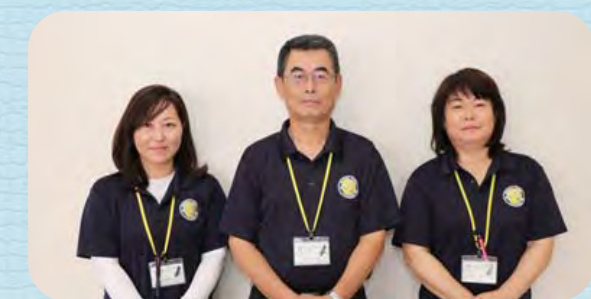
矢口集落支援員、照山集落支援員、林集落支援員