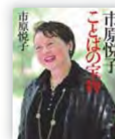
市原悦子 ことばの宝物 (市原 悦子 著)