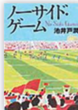
ノーサイド・ゲーム (池井戸 潤 著)