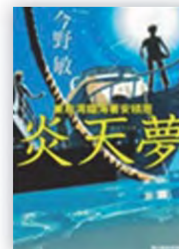
炎天夢 (今野 敏 著)

大手自動車メーカーのエリート社員だった君嶋隼人は工場の総務部長に左遷させられ、同社ラグビー部のゼネラルマネージャーを兼務することに。ラグビーの経験もない男が成績不振で低迷するお荷物社会人ラグビー部の再建に挑む。