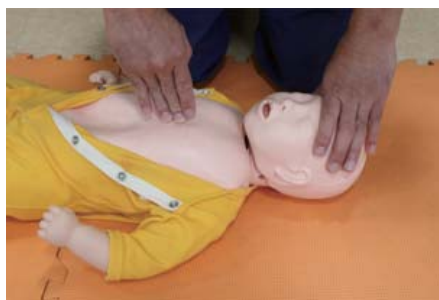
乳幼児に対する胸骨圧迫