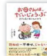
お母さんは だいじょうぶ (楠 章子 文)