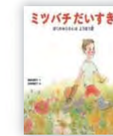
ミツパチだいすき (藤原 由美子 文)