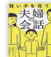
賢い子を育てる 夫婦の会話 (天野 ひかり 著)