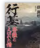
行基 (岳 真也 著)