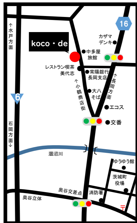
茨城町小鶴168 駐車場有3台まで

子どもたちの勉強スペースとしての活用はもちろん、誰かと一緒に話したり、休憩したりも大歓迎！どうぞお気軽にお立ち寄りください！