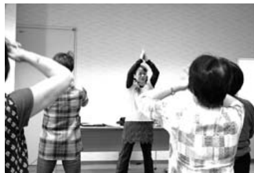
茨城シニアマスター活動の様子

元氣シニアバンクに登録された方は、「茨城シニアマスター」として、県内様々な施設、団体等の依頼に応じて活動します。 くわしくは、左記までお問い合わせください。