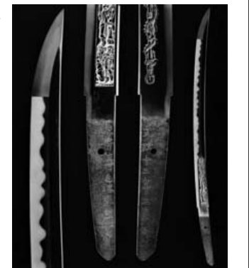
脇差 銘 水府住市毛徳郷謹鍛之 文政十二年二月日(個人蔵)

近世以前の茨城では、各地で刀工や金工師が鎧や鑿をふるい、あまたの刀剣とその外装たる刀装・刀装具が生み出されました。今回の展示では、当地に産した刀剣類の優品を中心に、郷土の刀剣文化を物語る史資料を展示します。千変万化の鋼と多種多様な色金が織りなす美の世界をご堪能下さい。