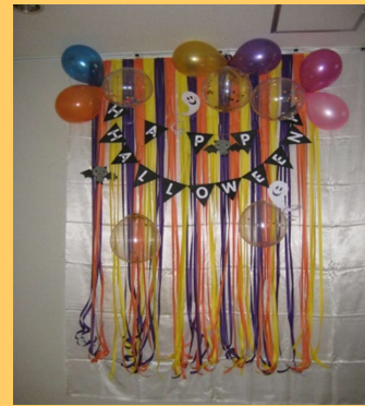
（撮影コーナーのイメージ）