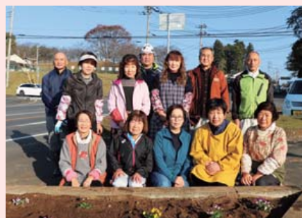
大戸下郷地区環境美化の会