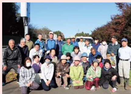
上郷地区環境美化ボランティアクラブ