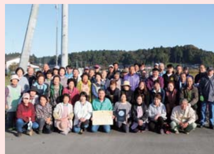
前田さくらロード環境美化の会

11月7日(日)、20日(土)には、各区で色とりどりのビオラの苗を植えるなど、区をあげてさらなる美化活動に取り組みました。