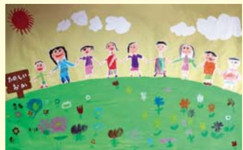
「みんなともだち うれしいな」