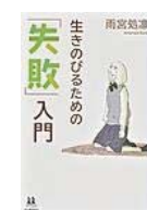
生きのびるための 『失敗』入門 (雨宮 処凛 著)