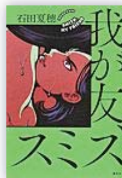
我が友、スミス (石田 夏穂 著)

筋トレに励む会社員・U野は、ジムで自己流のトレーニングをしていたところ、O島からボディビル大会への出場を勧められ、本格的な筋トレと食事管理を始める。しかし、大会で結果を残すためには筋肉のみならず「女らしさ」も鍛えなければならなかった。鍛錬の甲斐あって身体は仕上がっていきが……。