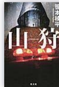
山狩 (笹本 稜平 著)

伊予ヶ岳の山頂付近で発見された若い女性の死体。事故死あるいは自殺とされたが、彼女が最近までストーカー被害に遭っていたことがわかる。千葉県警生活安全捜査隊の山下は彼女の死へストーカーの関与を疑うが、加害者は名家の御書司で事情聴取にも妨害が入る。さらにその家族が銃撃されたという通報が入り、混乱は極まる。