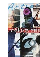
アクトレス (誉田 哲也 著)