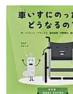
車いすにのったら どうなるの? (ハリエット・ブランドル 作)