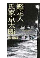
鑑定人 氏家京太郎 (中山 七里 著)