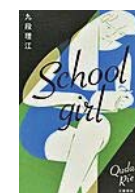
School girl (九段 理江 著)