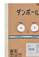
ダンボール (ユン・ヨリム 文)