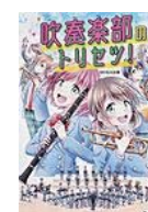
吹奏楽部の トリセツ! (松元 宏康 監修)