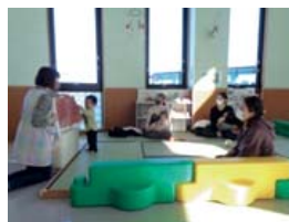
◀まんまるたいむの様子▶

時間 午前11時～11時15分 「からだであそぼう」 「リズムであそぼう」 「ふれあいあそび」 「わくわくおはなし」などを日替わりで行います。