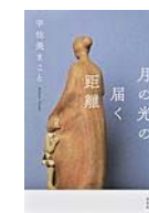
月の光の届く距離 (宇佐美 まこと 著)