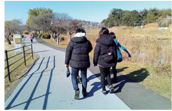
婚活ウォーキングイベントの様子

春は出会いの季節！ あたたかく、心とからだだがストレスフリーになるこちよこの時期は、新たな出会いを求めるのにぴったりです。 昨年9月に開設した 茨城町きらりキューピット支援センター では、新規会員を募集しています。現在センターでは、会員同士のお見合いやプロフィールの閲覧などを実施し、独身者の方の新しい出会いを応援しています！ ぜひ、お気軽に当センターまでお問い合わせください。 ▶ 対象者 結婚を希望する独身の方 (住所・年齢・初婚・再婚を問いません) ▶ 入会受付日・相談日 火曜日・水曜日・土曜日 ※専任の相談員が対応するため、完全予約制となります。