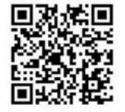
新規会員はこちらから

春は出会いの季節！ あたたかく、心とからだだがストレスフリーになるこちよこの時期は、新たな出会いを求めるのにぴったりです。 昨年9月に開設した 茨城町きらりキューピット支援センター では、新規会員を募集しています。現在センターでは、会員同士のお見合いやプロフィールの閲覧などを実施し、独身者の方の新しい出会いを応援しています！ ぜひ、お気軽に当センターまでお問い合わせください。 ▶ 対象者 結婚を希望する独身の方 (住所・年齢・初婚・再婚を問いません) ▶ 入会受付日・相談日 火曜日・水曜日・土曜日 ※専任の相談員が対応するため、完全予約制となります。