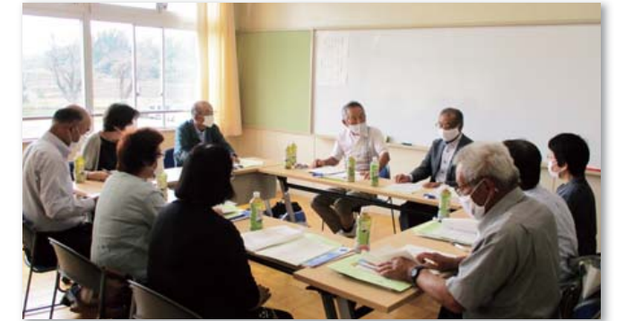
地区別懇談会の様子

一人暮らしの高齢者など、地域住民への訪問活動を行っています。困っていることや、不安に感じていることなどの把握に努めています。