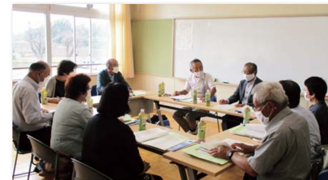
地区別懇談会の様子

一人暮らしの高齢者など、地域住民への訪問活動を行っています。困っていることや、不安に感じていることなどの把握に努めています。