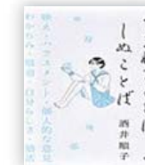
うまれることば、しめことば (酒井 順子 著)