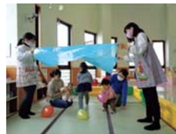
《まんまるたいむの様子》

時間 午前11時～11時15分 「からだであそぼう」 「リズムであそぼう」 「ふれあいあそび」 「わくわくおはなし」 などを日替わりで行います。