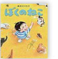
ぼくのねこ (鈴木 のりたけ 作)