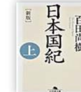
日本国紀(上・下巻) (百田 尚樹 著)