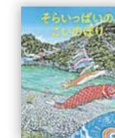
そらいっぱいこのいぼり (羽尻 利門 作)