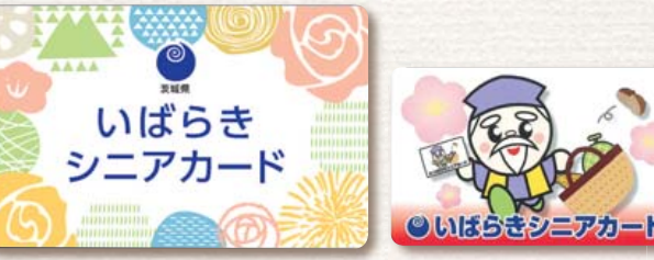
新カード 旧カード

4月1日より、「いばらきシニアカード」のデザインが新しくなりました。 シニアカードとは、65歳以上の方であれば、どなたでもご利用できるカードです。協賛店舗に提示すると、割引やポイント加算等のお得なサービスを受けることができます。長寿福祉課の窓口で配付を行っていますので、身分証明書 (生年月日がわかるもの) を持参のうえ、窓口までおこし下さい。 ※従来のデザインのものでも、これまでどおり利用する事は可能です。