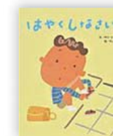
はやくしなさい! (中川 ひろたか 作)