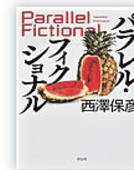
平行・フィクショナル (西澤 保彦 著)

夢の答え合わせ…そう聞いて人は何を思い描くだろう。モトくんとなたしが個別に見る夢、そして答え合わせするのは、身も蓋もない現実の予見。しかも常に人の死にかかわるもの。予知夢を見る男女は皆殺しの惨劇を回避できるのか。そして凶悪な殺意の主とは。あなたはこの結末に驚かすにはられない。