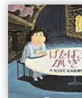
げたばこかいぎ (村上 しいこ 作)