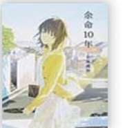
余命10年 (小坂 流加 著)