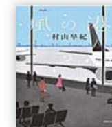
風の港 (村山 早紀 著)