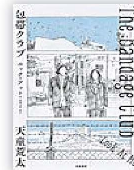
包帯クラブ (天童 荒太 著)

関東のはずれの町に暮らす高校生6人。彼らはそれぞれに傷ついた少年少女たちだった。戦わないう形で自分たちの大切なものを守りたい、その思いから彼らは包帯クラブを結成。人が傷ついた場所に包帯を巻く活動は、無理解や反発などを受け自粛を余儀なくされ、別の形で包帯クラブの実現を試みる。