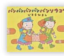
バンバンバンバンソウコウ (いとう ひろし 作)