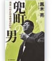
兜町男 清水一行と日本経済の80年 (黒木 亮 著)