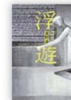
浮遊 (遠野 遥 著)