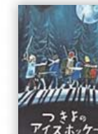
つきよのアイスホッケー (ポール・ハーブリッジ 文)