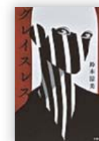
グレイスレス (鈴木 涼美 著)