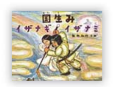
国生みイザナギイザナミ (飯野 和好 文)