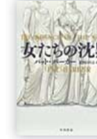
女たちの沈黙 (パット・パーカー 著)