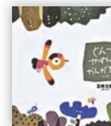
とんでやすんでかんがえて... (五味 太郎 作)