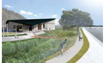
涸沼水鳥・湿地センター（仮称）完成イメージ図

脱炭素社会の実現に向け、再生可能エネルギーを活用した町づくりビジョンを策定します。また、太陽光発電の導入促進を図るため、家庭用蓄電システムの設置費用の一部助成を拡充します。