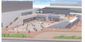
文化的施設完成イメージ図

茨城町へ移住した就業者を含む世帯を対象に、支援金を交付し、移住時の経済的な負担軽減とともに定住の促進を図ります。