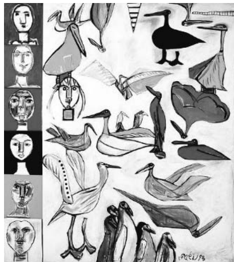
猪熊弦一郎 《飛ぶ日のよるこび》1993年 丸亀市猪熊弦一郎現代美術館蔵 ©公益財団法人ミモカ美術振興財団