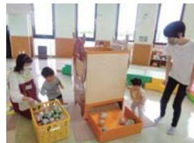
まんまるたいむの様子

時間 午前11時～11時15分 「わくわくおはなし」「ふれあひあそび」「リズムであそぼう」などを日替わりで行います。