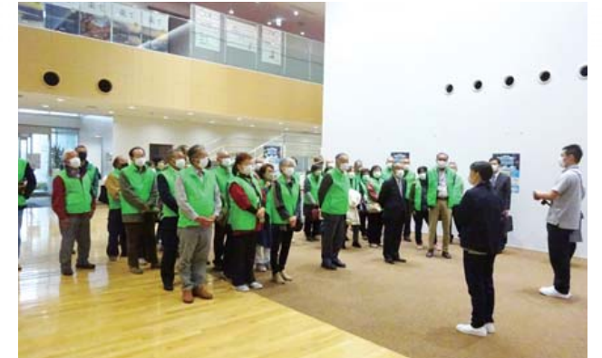
令和4年度全体視察研修 (福島県三春町 コミュタン福島 福島県環境創造センター交流棟)

日常の暮らしの中で悩み事を抱えている方は、各地区担当の民生委員・児童委員までご相談ください(委員一覧は、広報いばらき2月1日号に掲載しています)。