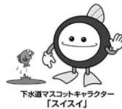
下水道マスコットキャラクター「スイスイ」

【問合せ先】 下水道課 公共下水道グループ ☎ 029-240-7127（直通）