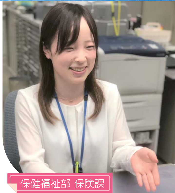
保健福祉部 保険課