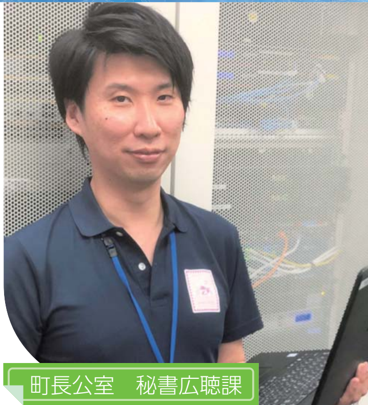
町長公室 秘書広聴課