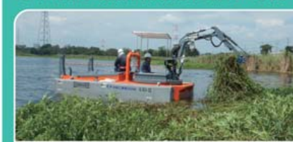
●水陸両用作業船：コンバー(写真) ●アオコ除去装置：アルデア

河川、湖沼、水路、揚水機場、貯水施設など水面に拡がる迷惑な水生植物やアオコを除去します。