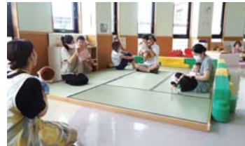
まんまるたいむの様子

時間 午前11時～11時15分 「わくわくおはなし」「ふれあいあそび」「リズムであそぼう」「わくわく製作」などを日替わりで行います。