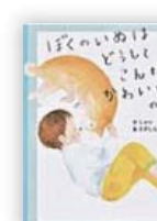
ぼくのいぬはどうしてこんなにかわいいのか (しゅん 作)