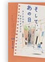
そして、あの日 (リンデル・クロムハウト 作)