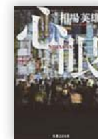
心眼 (相場 英雄 著)