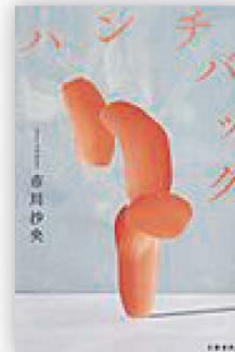
ハンチバック (市川 沙央 著)

重度障がい者の井沢釈華の背骨は右肺を押しつぶす形で極度に湾曲し、歩道に靴底を引きずって歩くことをしなくなって、もうすぐ30年になる。両親が終の棲家として遺したグループホームの十畳の自室から某有名私大の通信課程に通い、小説をサイトに投稿しあらゆる言葉を送り出す。「文学界」掲載を書籍化。