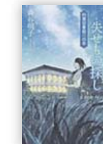
星合う夜の失せもの探し (森谷 明子 著)