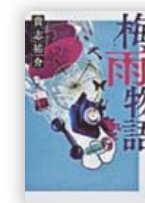
梅雨物語 (貴志 祐介 著)