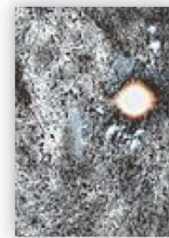
我が手の太陽 (石田 夏穂 著)

鉄鋼を溶かす高温の火を扱う溶接作業はどの工事現場でも花形的存在。その中でも腕利きの伊東は自他ともに認める熟達した接工だ。そんな伊東が突然、スランプに陥った。日に日に失われる職能と自負。現場仕事をこなしたい、そんな思いに駆られ、伊東は…。異色の職人小説。「群像」掲載を単行本化。