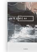
# #NAME# # (児玉 雨子 著)