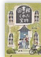
図書館がくれた宝物 (ケイト・アルバス 作)