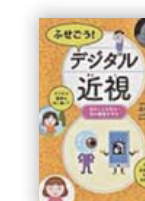
ふせごう! デジタル近視 (北明 大洲 監修)