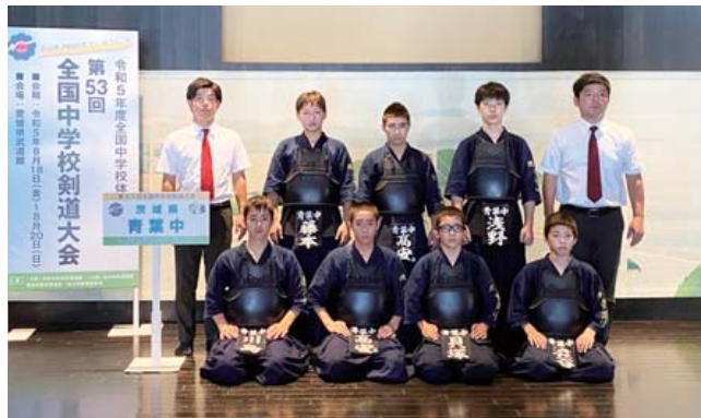
剣道部 男子団体(青葉中)