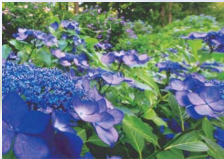
「ブルーに魅せられて」