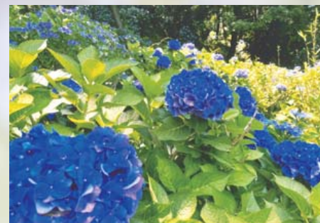
「紫陽花のステージ」