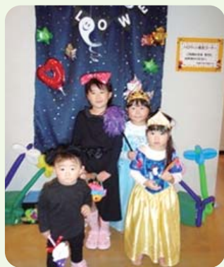
昨年度の写真撮影コーナー

*衣装の貸出はございません。 *背景の装飾は写真とは異なります。 *状況により実施しないことがあります。