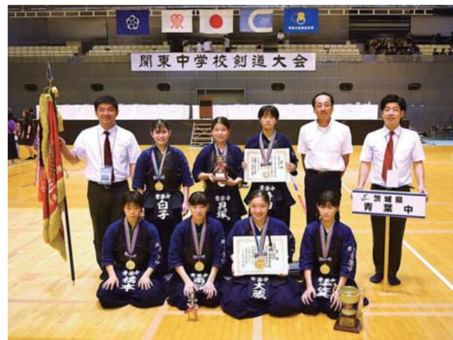
剣道部 女子団体(青葉中)