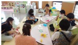
〈まんまるたいむの様子〉

時間 午前11時～11時15分 「からだであそぼう」「ふれあひあそび」「リズムであそぼう」「わくわく製作」などを日替わりで行います。