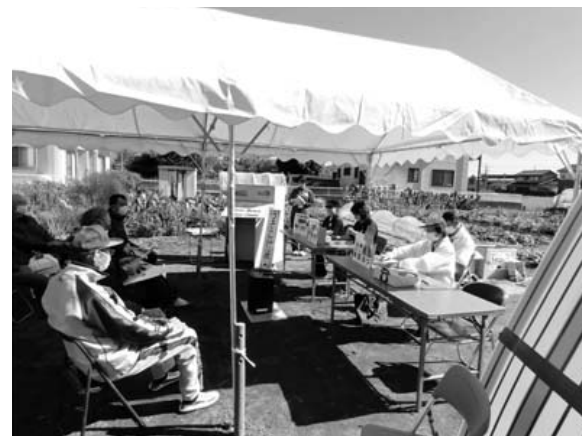
【前田東区】 高齢者消費被害防止講座の様子

茨城町コミュニティ助成事業は、町民のコミュニティ活動の推進を図ることを目的に実施している事業で、ハロウィンジャンボ宝くじの収益金による市町村振興交付金が財源となっています。