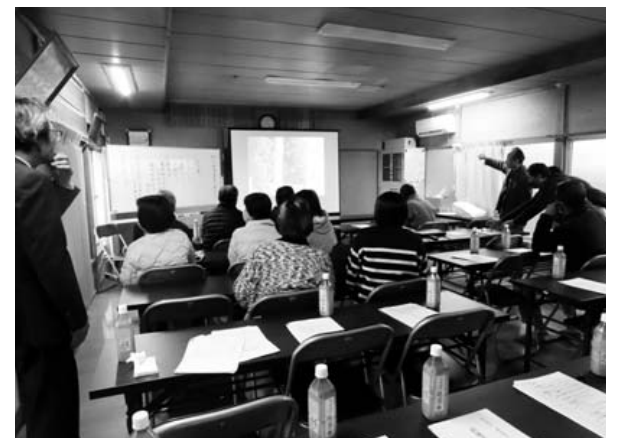
【神宿区】 郷土の歴史にまつわる講演会の様子 整備した備品 エアコン、プロジェクター、スクリーンなど