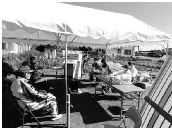
【前田東区】 高齢者消費被害防止講座の様子 整備した備品 テント、イス、テーブルなど

茨城町コミュニティ助成事業は、町民のコミュニティ活動の推進を図ることを目的に実施している事業で、ハロウィンジャンボ宝くじの収益金による市町村振興交付金が財源となっています。