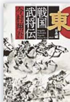
戦国武将伝 東日本編 (今村 翔吾 著)

織田信長、徳川家康、武田信玄、上杉謙信…北海道・東北・関東・中部地方の武将23人の、心震えるエピソードを描いた掌編小説集。文献から拾い上げた逸話をもとに、戦国時代に生きる武将たちの喜びや苦悩が、笑いあり、涙ありの多様なテイストの小説として描き出されています。掌編だけを集めた作品で、各都道府県の戦国武将を一人ずつ取り上げて物語を紡いでいます。