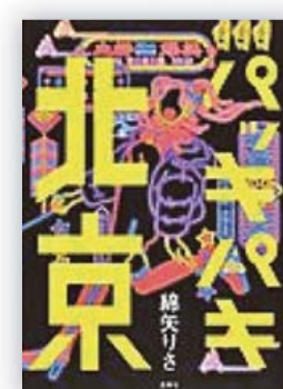
パッキパキ北京 (綿矢 りさ 著)

味わい尽くしてやる、この都市のギラつきのすべてを。コロナ禍の北京で単身赴任中の夫から、一緒に暮らそうと乞われた菖蒲(アヤメ)。愛犬ペイペイを携えしづし中国に渡るが、「人生エンジョイ勢」を極める菖蒲、タダじゃ絶対に転ばない。過酷な隔離期間も難なくクリアし、現地の高級料理から超絶ローカルフードまで食べまくり、お祭り騒ぎを堪能する。