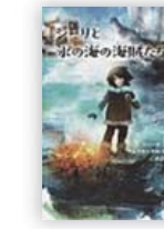
シーリと氷の海の 海賊たち (フリーダ・ニルソン 作)