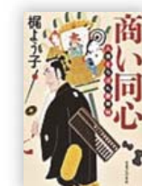
商い同心 人情 そろばん御用帖 (梶 よう子 著)