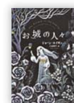
お城の人々 (ジョン・エイキン 著)