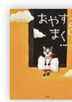
おやすみまくら (斉藤 倫文)