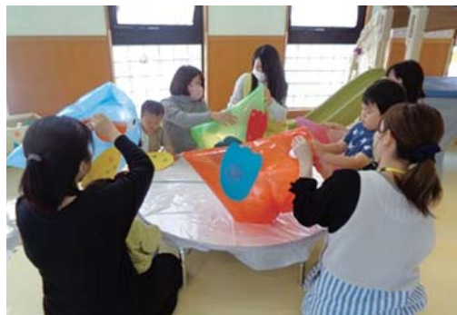
まんまるたいむの様子

時間 午前11時～11時15分 「わくわくおはなし」「ふれあいあそび」「リズムであそぼう」「わくわく製作」などを日替わりで行います。