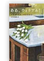
ああ、ウィリアム! (エリザベス・ストラウト 著)