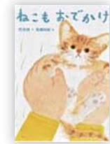
ねこもおでかけ (朽木 祥作)