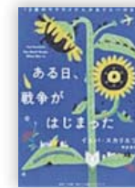
ある日、戦争が はじまった (イェバスカリエツカ 著)