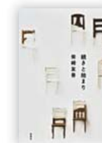
続きと始まり (柴崎 友香 著)