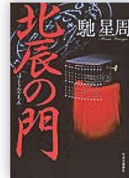
北辰の門 (馳 星周 著)

時は天平。都には天然痘が蔓延し、朝廷にて我が世の春を謳歌していた藤原一族も権勢に陰りを見せていた。その中において、ひとり異彩を放つ男がいた。藤原仲麻呂。出世の階段を駆け上がる藤原仲麻呂は危険な野望を秘めていた。次代の天皇である阿倍内親王の仲麻呂への恋慕の情が憎しみに転じた時、時代の歯車が軋み始める。この国の皇帝となる道を開こうとした男の、鮮烈なる一生。