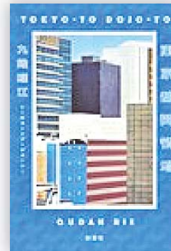
東京都同情塔 (九段 理江 著)

ザハの国立競技場が完成し、寛容論が浸透したもう一つの日本で、新しい刑務所「シンパシータワーキーヨー」が建てられることに。犯罪者に寛容になれない建築家・牧名沙羅は、仕事と信条の乖離に苦悩しながらパワフルに未来を追求する。ゆるふわな言葉と、実のない正義の関係を豊かなフロウで暴く、生成AI時代の預言の書。第170回芥川賞受賞作!