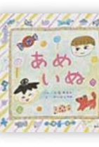
あめいめ (工藤 有為子 ぶん)