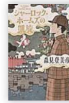
シャーロック・ホームズの凱旋 (森見 登美彦 著)