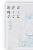
ぼくは青くて透明で (窪 美澄 著)