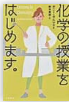
化学の授業をはじめます。 (ボニー・ガルマス 著)