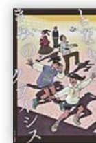
となりのきみのクライシス (濱野 京子 作)