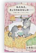
ねえねえ、きょうのおはなしは…… 世界の楽しいむかしばなし (大塚 勇三 再話・訳)