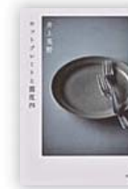
ホットプレートと震度四 (井上 荒野 著)