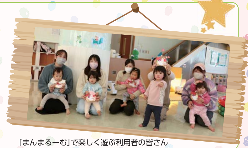
「まんまる一む」で楽しく遊ぶ利用者の皆さん